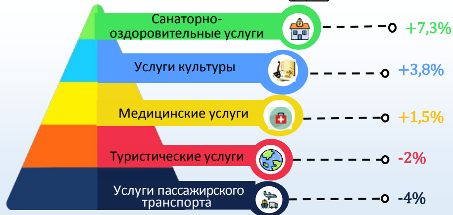
Январь-май 2022 г. к январю-маю 2021 г., %